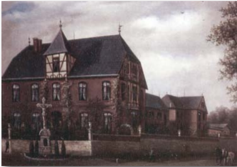
Schulgebäude 1843 -1945

Nach dem 2. Weltkrieg wurde das Vereinsleben jedoch nur noch im kleinen Kreis gepflegt. Durch fünf Gründungsmitglieder wurde am 14. Dezember 1987 der Verein neu konstituiert und mittlerweile beträgt die Mitgliederzahl wieder mehr als 250.