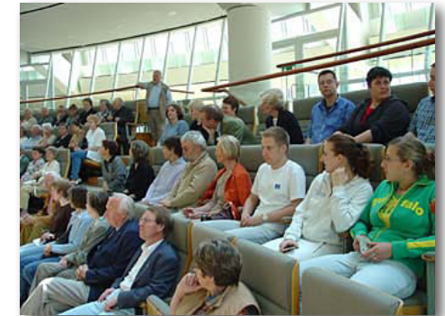
Besuch des Landtages NRW 2004

Gemeinsame Reisen zu nahen und fernen Zielen, erweitert um kulturelle Angebote, stehen auf dem Programm.